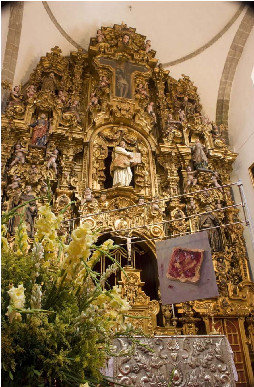
Pan con crema de cacahuete y mermelada, Óleo sobre lienzo 60 x 50 cm. 2008