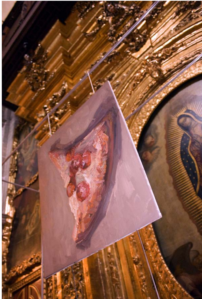
Rebanada de pizza I Óleo sobre lienzo