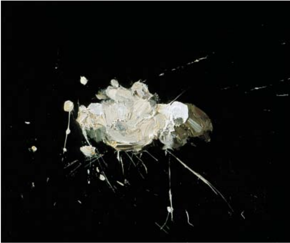
Nata Óleo sobre lienzo 50 x 60 2008