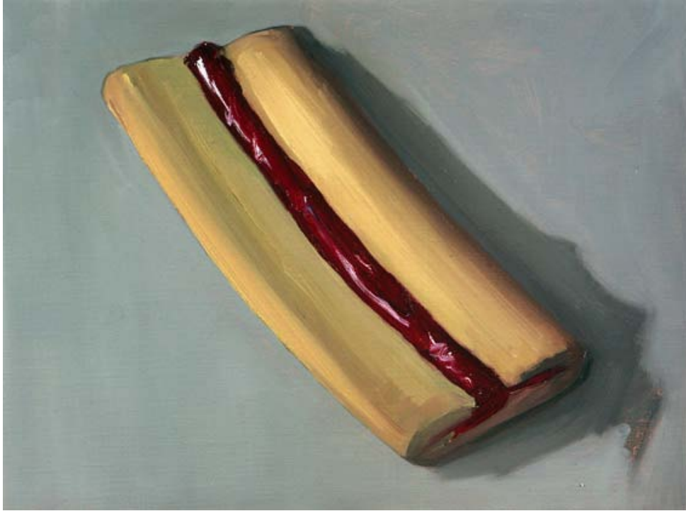
Galleta II Óleo sobre lienzo 30 x 40 cm 2009