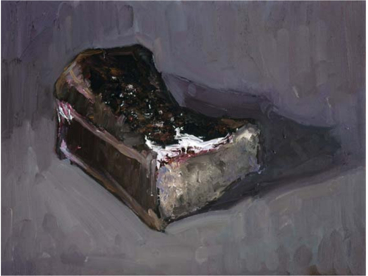
Pastel II Óleo sobre lienzo 30 x 40 cm 2008