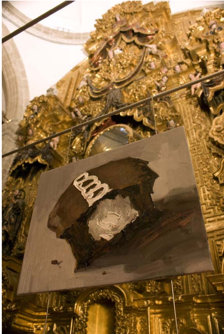
Pastel I Óleo sobre lienzo 40 x 50 cm. 2008