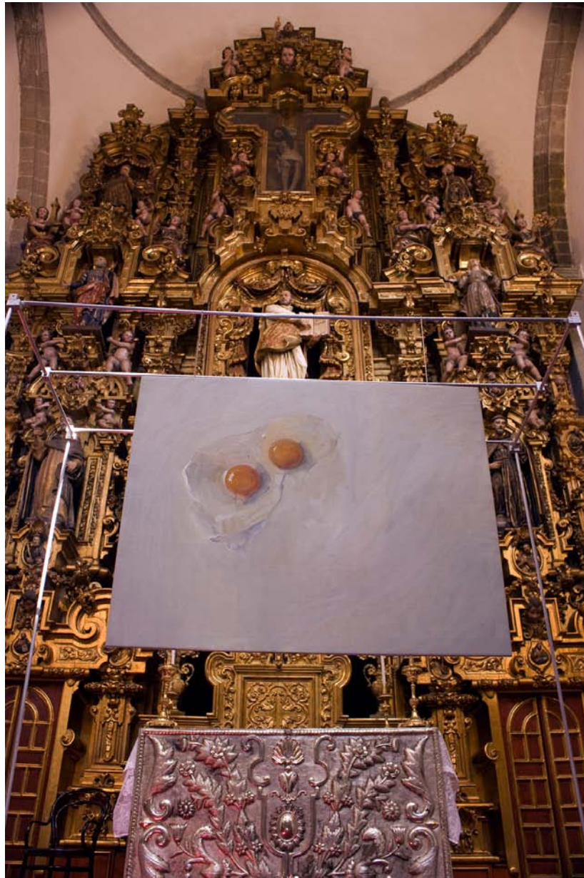
Santas Pascuas Óleo sobre lienzo 80 x 100 cm. 2009