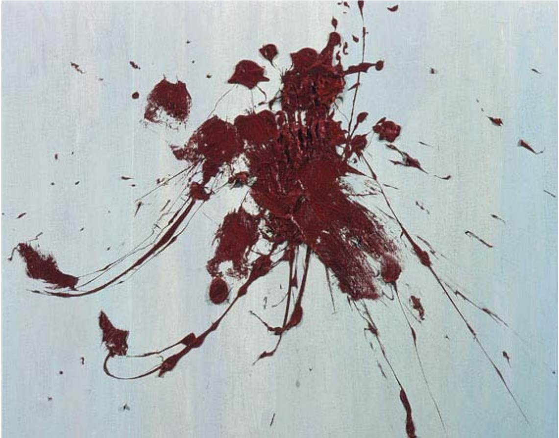
Catsup Óleo sobre lienzo 80 x 100 cm 2009